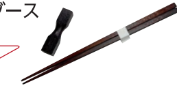
木曾ひのき箸&箸置セット(イメージ)

各自治体ブースにスタンプを設置。自治体 ブース(土曜は11ブース、日曜は10ブース) のうち、お好きな3カ所で押印すればOK!